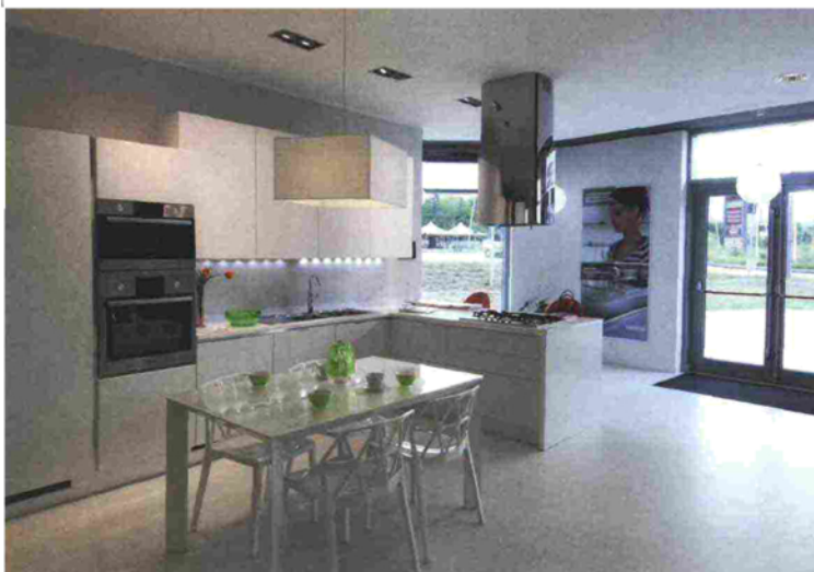
La cucina è il punto di forza, ma nello store si trovano anche soluzioni per il living e per il bagno.